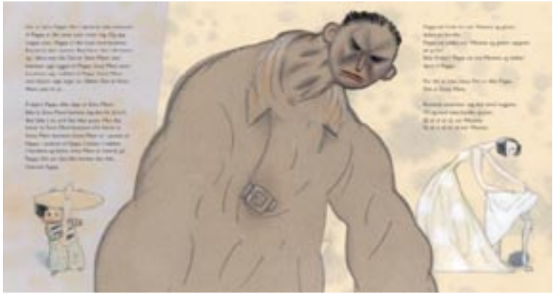
Illustrasjonene i Sinna Mann er laget som en blanding av blyanttegninger og papirkollasj